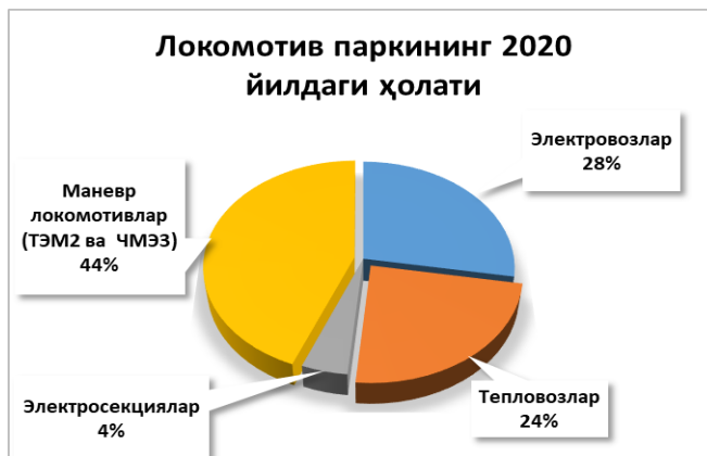
1-диаграмма: Локомотив паркининг 2020 йилдаги ҳолати

Биринчи ва иккинчи диаграммада 2020-2021 йиллардаги тортув ҳаракат таркиби турларини фоизлардаги улуши кўрсатилган.